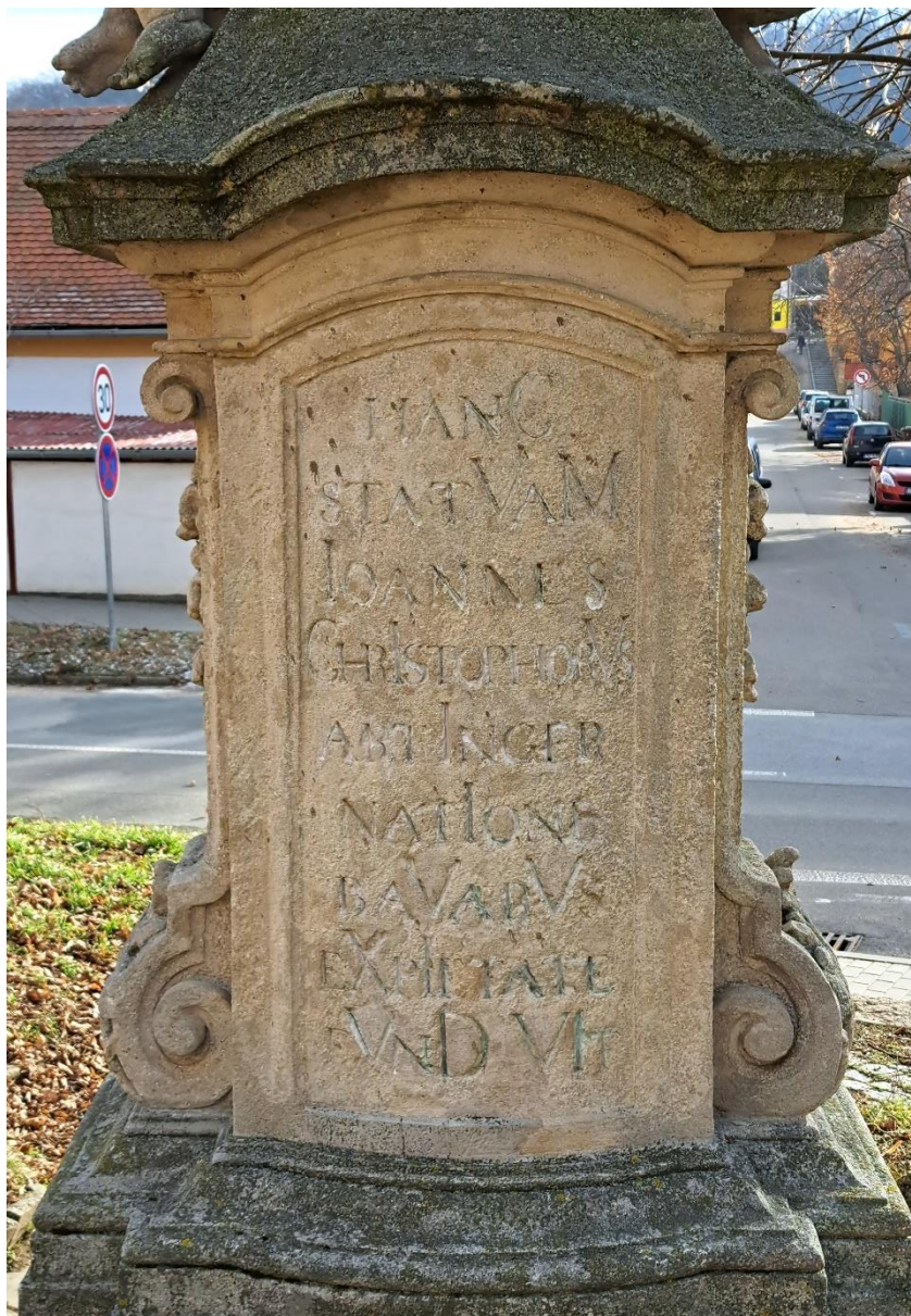
Sousoší sv.Jana Nepomuckého