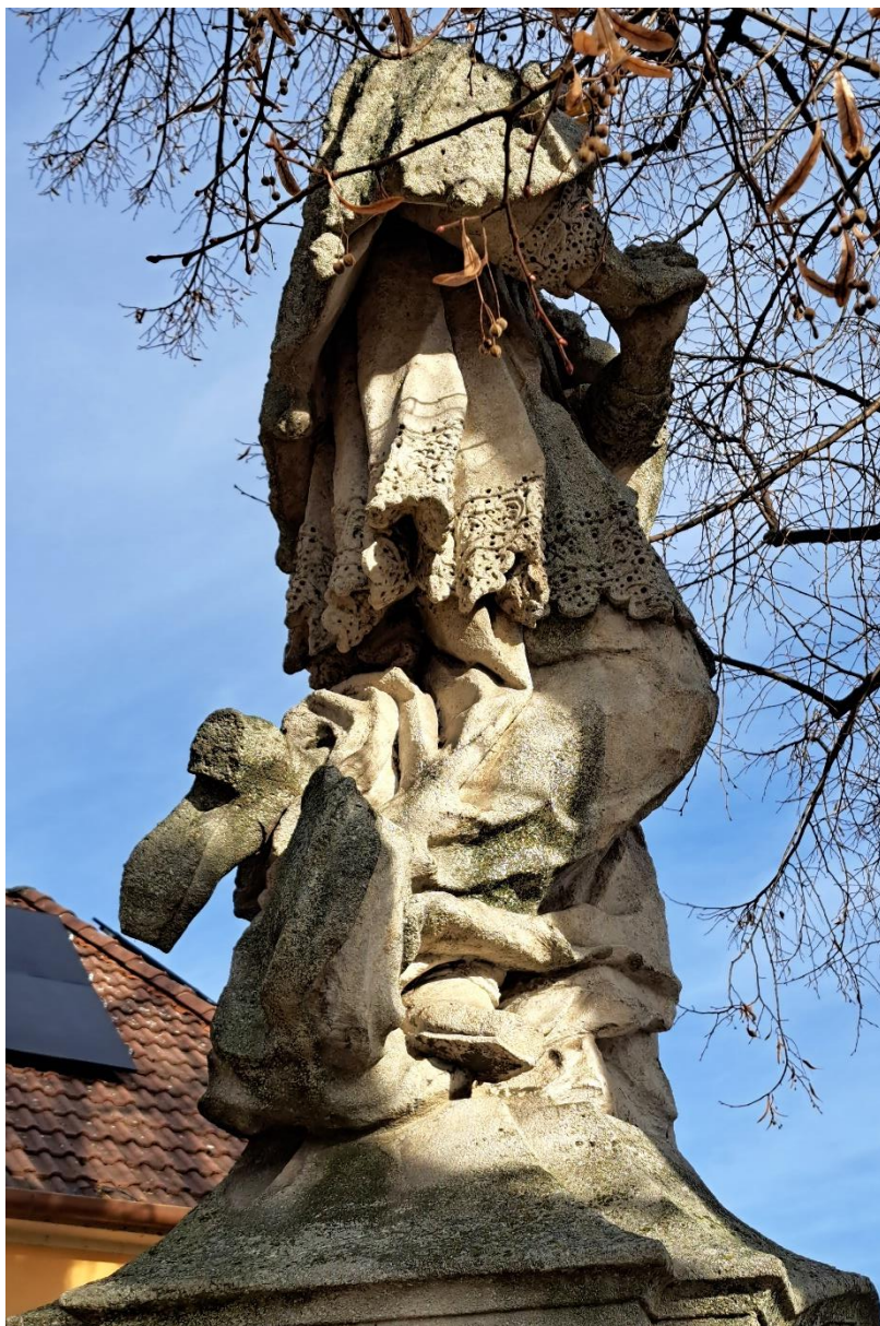
Sousoší sv.Jana Nepomuckého