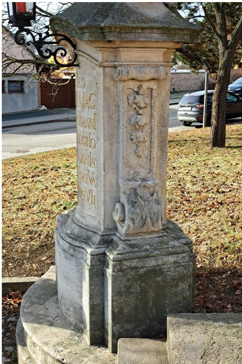
Sousoší sv.Jana Nepomuckého