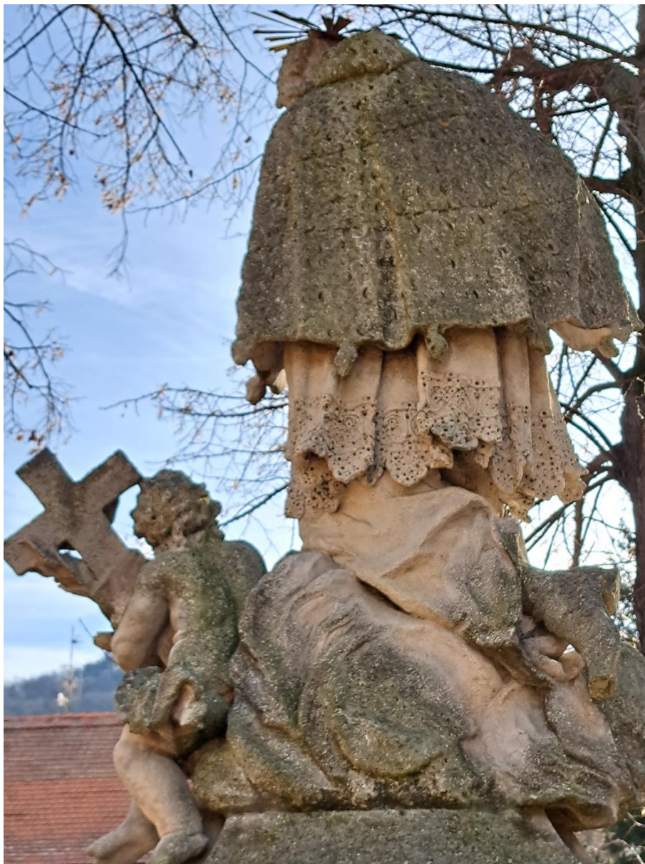
Sousoší sv.Jana Nepomuckého