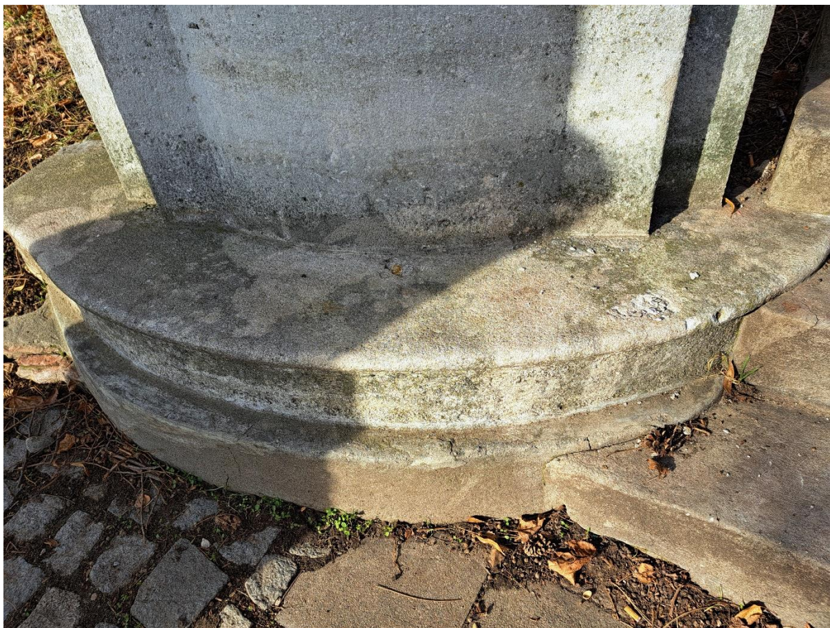
Sousoší sv.Jana Nepomuckého Podnož s rozsáhlými doplňky z umělého kamene Stav na počátku roku 2024