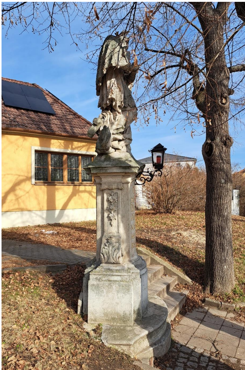
Sousoší sv. Jana Nepomuckého