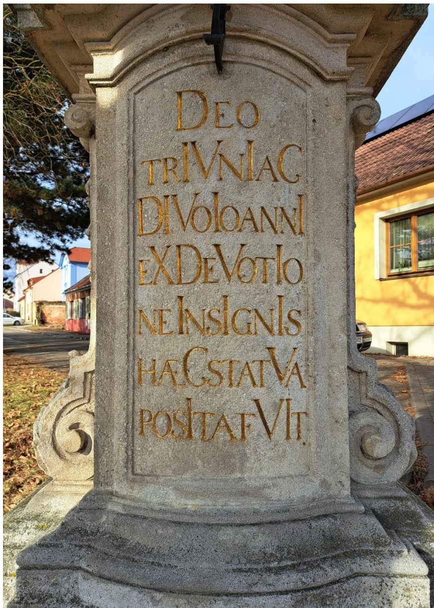
Sousoší sv. Jana Nepomuckého