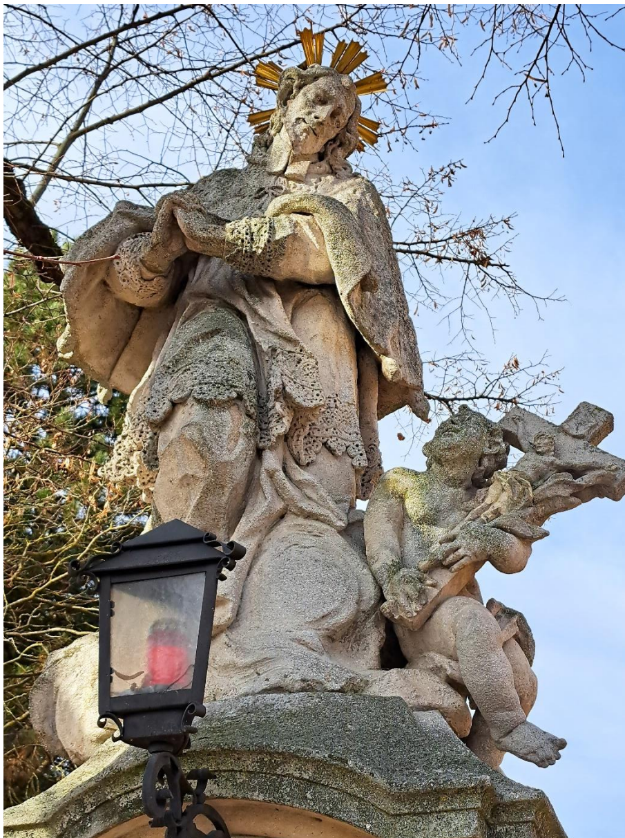
Sousoší sv.Jana Nepomuckého Stav na počátku roku 2024