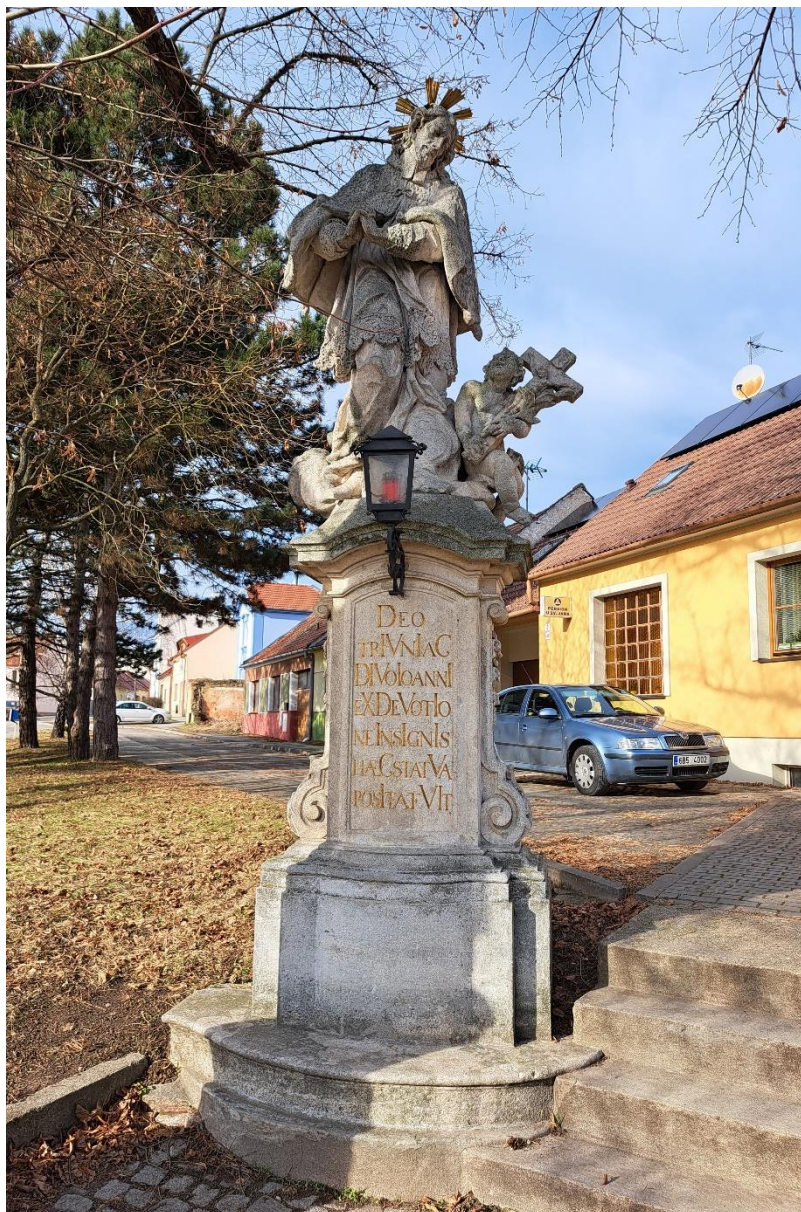
Sousoší sv.Jana Nepomuckého