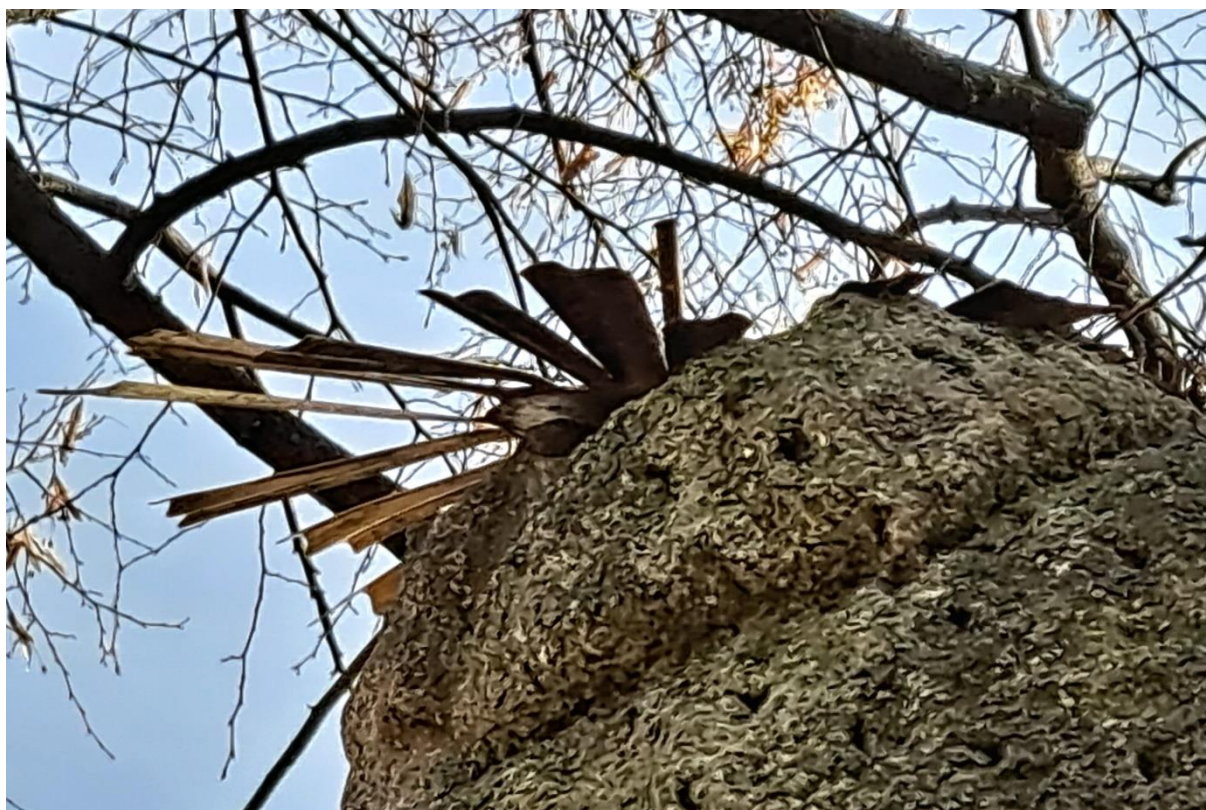
Mírně deformovaná svatozář