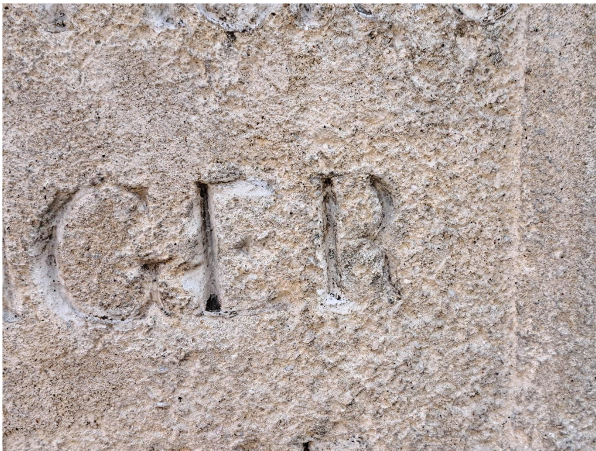
Sousoší sv.Jana Nepomuckého Detail povrchu zadní strany podstavce Stav na počátku roku 2024