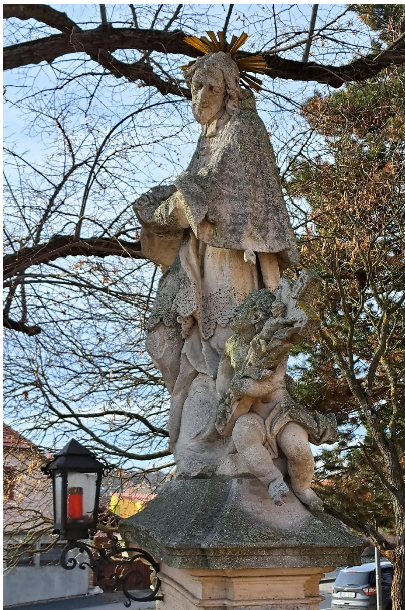
Sousoší sv.Jana Nepomuckého