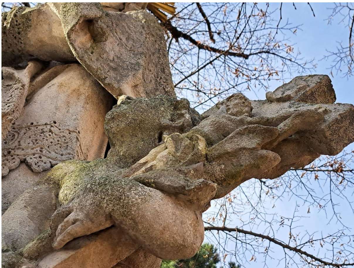
Sousoší sv.Jana Nepomuckého